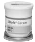
A-O Margin, A-O Dentin, A-O Incisal, A-O Bleach, A-O 690°C