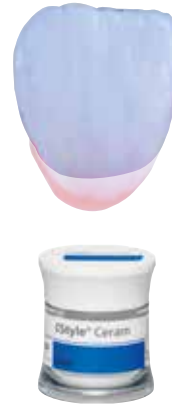
I BL, I 1, I 2, I 3, I 4, I 5

IPS Style Ceram Incisalmassen sind dem natürlichen Schneidemassematerial nachempfunden und führen in Kombination mit den Dentinmassen zur korrekten A-D-Farbschlüsselfarbe.