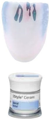
SI yellow, SI grey

The IPS Style Ceram Special Incisal materials may either be mixed with IPS Style Incisal materials to modify and intensify the shade or applied directly.