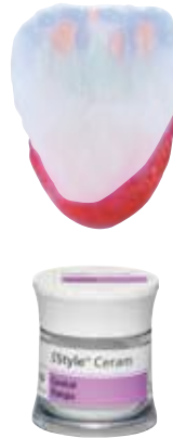
CT yellow, CT orange-pink, CT khaki, CT orange

IPS Style Ceram Cervical Transpa-massen reproduzieren Farben mit einer intensiveren Transluzenz und unterstützen den natürlichen Übergang von der Gingiva zur Verblendung.