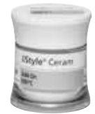
A-O Margin, A-O Dentin, A-O Incisal, A-O Bleach, A-O 690°C